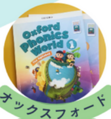
オックスフォード 教材を採用