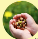
ワールドトリップ