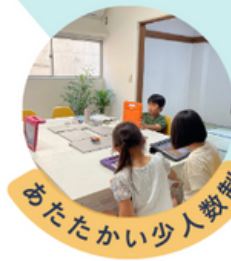
めったかい少人数制

英語圏の子どもたちに英語を教える指導法、「フォニックス」を採り入れ、初めて英語と出会う子どもたちの「聴く・話す・読む・書く」力を楽しみながらバランスよく育みます